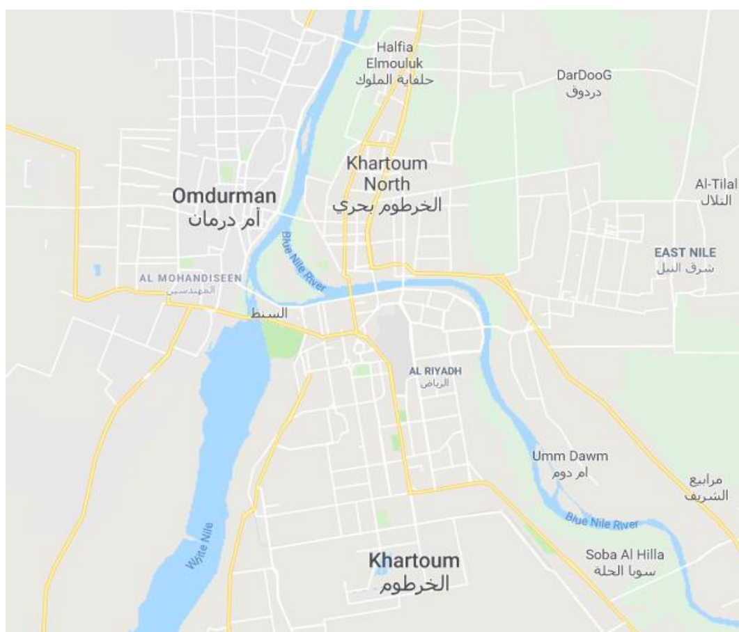
Khartoum, Sudan 218

De grootste stedelijke agglomeratie van Soedan bevindt zich rondom de hoofdstad Khartoem, aan de samenvloeiing van de Blauwe en de Witte Nijl, en behelst ook Noord-Khartoem (of Bahri), op de noordelijke oever van de Blauwe Nijl en de oostelijke oever van de Nijl, en Omdurman, op de westelijke oever van de Nijl. 217 In dit rapport verwijst Khartoem naar heel deze agglomeratie.