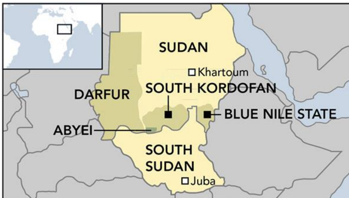
Map of the 'Two Areas', South Kordofan and Blue Nile 24

De Two Areas omvatten de twee zuidelijke deelstaten Zuid-Kordofan en Blauwe Nijl.